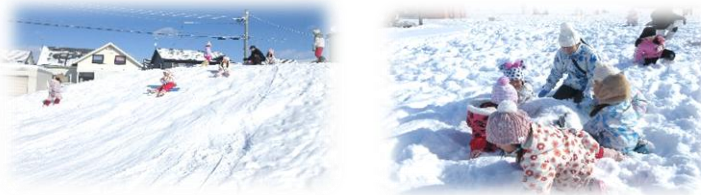
いちい公園のそり遊び。みんなで行くといいね

縦割り保育でほぷら組、いちよう組、もみじ組でいちい公園へ行きそり遊びをしました。ちょうど雪が降った後でそり滑りのほか、雪にまみれて遊んでいました。最後にお菓子のゼリーさがしをしました。冷たいゼリーはジュースのようでおいしかったね！