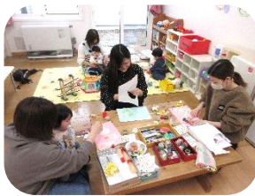
身体測定をした後に、お子さんの写真と足形をとって、デコレーションしました！

5月は、戸外で過ごすのには気持ちの良い季節となっていくと思いますので、たくさんお出掛けして春の自然に触れられたらと思います。皆さんの参加をお待ちしていますね！