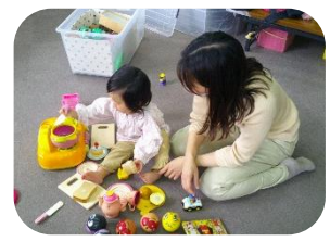
児童センターの玩具でゆっくり好きな遊びを楽しみました。