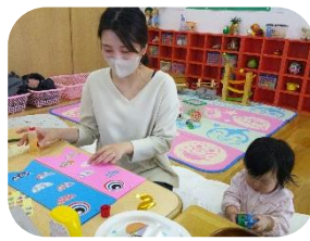
「子どもの日」に向けてこいのぼりを作りました。可愛らしくできましたよ！