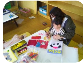
お子さんの作品を入れる作品帳の表紙をフェルトで作りました。