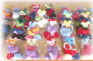
卒園記念のマフラー