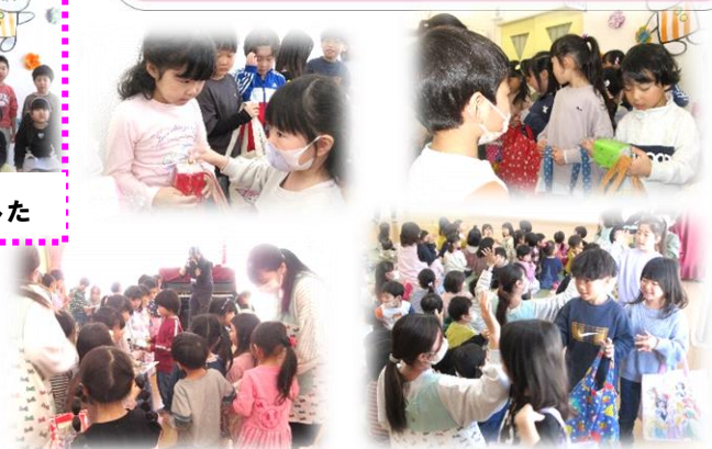
小さい組から手作りプレゼントを貰いました