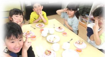
もみじ組手作りケーキを作ったよ