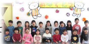
いちよう組が歌を歌ってくれました

もみじ組とのお別れ会をしました。いちよう組がもみじ組に「もみじ組さんありがとう」の気持ちを込めて替え歌を歌ってくれました。歌詞は子供たちで考えたようです。それから全クラスのお友だちから「たくさん遊んでくれたね」「お世話をしてくれたね」と感謝の気持ちと「学校へ行っても頑張るね」のエールをこめて手作りプレゼントをもらいました。ペン立てや手紙入れ、自由画帳など小学校へ行っても使えるようなものでもみじ組さんも嬉しそうでした。今まで行事の中心になってくれたもみじ組さん。小さい子に優しくお世話をしてくれました。小学校へ行っても頑張るね。