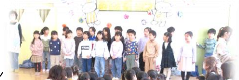
お別れ会のもみじ組・歌を歌ってくれました

最後になりましたが、私はこの3月で園長を退任いたします。2年間という短い期間でしたが、楽しく過ごさせていただきました。ご協力、本当にありがとうございました。