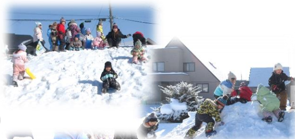
ぼぶら・いちようもみじ組で行ったそり遊び。そり滑りもみかん拾いも楽しかったね