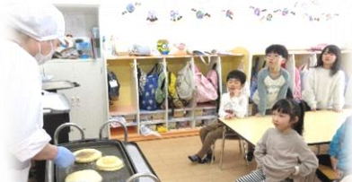
もみじ組の午睡しない日に給食の先生がホットケーキを焼いてくれました。